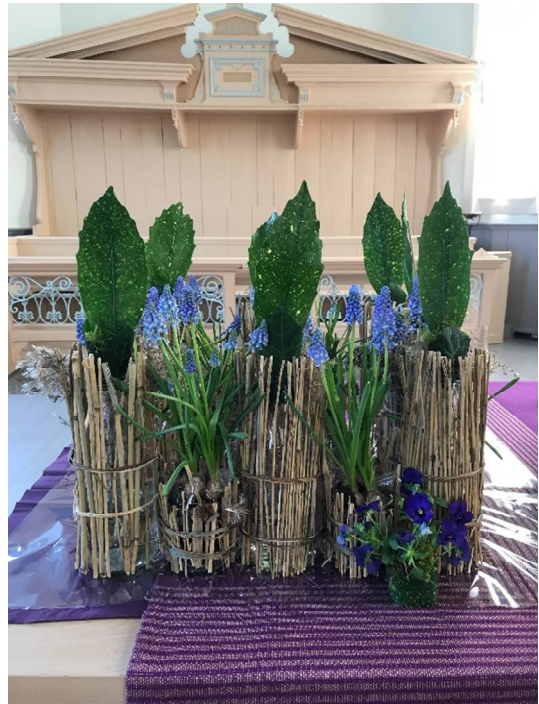
Liturgische bloemschikking 7 april 2019

De dienst van 16 juni zal in het teken staan van het dorpsfeest. Een traditie van jaren geleden wordt weer in ere hersteld: kerkdienst in de tent. Medewerking zal worden verleend door Adri de Boer.