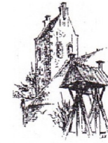
Olde- en Nijeberkoop